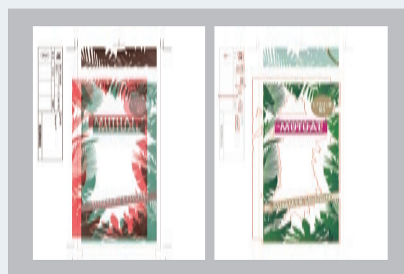
当社開発「チェックシステム」を自動化