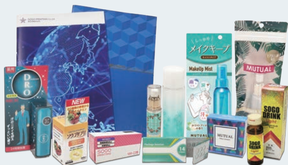
デザイン・クリエイティブ (パッケージ、ラベル、PTP、リーフレット、他)