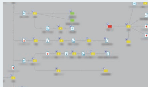
編集、検査自動化フロー

RPAとワークフロー自動化ソフトを活用し、膨大な反復作業を伴う「データの確認・検査工程」をアプリケーションと連動させ自動化いたしました。編集後のデータには、その安全性を担保するための厳格な検査が不可欠です。本システムでは弊社のノウハウに基づいたルールを自動適用することで、単純作業の負担を軽減。データ受け渡し時のヒューマンエラーを防止する「編集・検査フロー自動化システム」を構築しました。